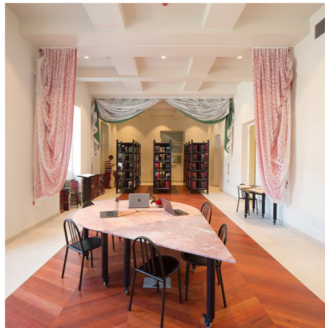
COD, Tirana (2015) Doorzon interieurarchitecten i.s.m. 51N4E.

Een project dat mij enorm is bijgebleven is het Center for Openness and Dialogue te Tirana, (Albanië, 2015) door Doorzon interieurarchitecten (i.s.m. 51N4E). Het project spreekt me heel erg aan door de historiek ervan en de politieke geladenheid. Het is een verbouwing van de gelijkvloerse verdieping van een regeringsgebouw in Tirana tot een publieksgebouw. Er zijn nog steeds veel spanningen in het land, en het centrum moet openheid en dialoog stimuleren. Zo heeft Doorzon onder andere een tafel ontworpen die plaats maakt voor verschillende overlegscenario's. Het gebouw zelf is gelegen aan een lange boulevard in Tirana, en is ook vandaag nog het mikpunt van protesten. De combinatie van zowel historiek, politiek, architectuur en design maakt het een heel interessant project.