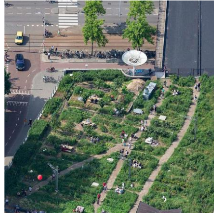
Beeld 7-8: Voorbeeldproject stadsnatuur: Dakakker + Park Pompenburg Rotterdam 2014-2019