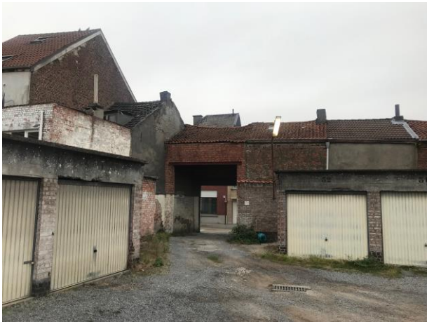
Beeld 9: Aalst, binnengebied met garageboxen – studiegebied Studio AAP 2019-2020 - Why Aalst?