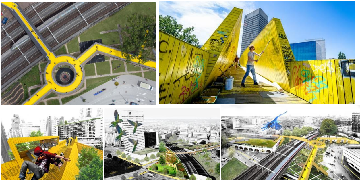
Beeld 2-6: Voorbeeldproject breed gedragen stadsrevitalisatie: Luchtsingel / Park Pompenburg Rotterdam 2014-2019