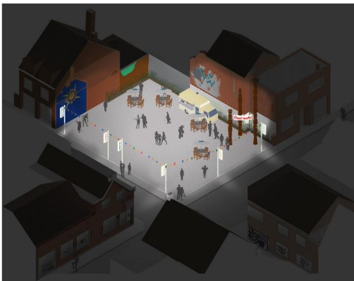
Beeld 10: Lichtproject met restanten van gevelreclame in Doel (Toon Claerbout, 2020)