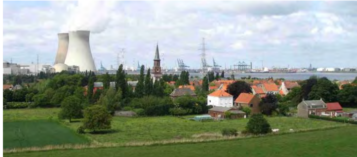
Doel, panorama op dorp, kerncentrale, Schelde en Haven van Antwerpen