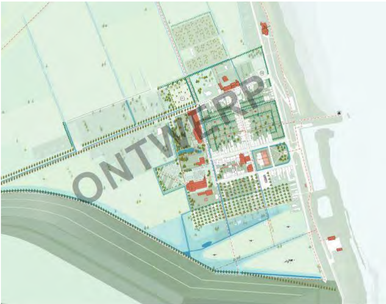
Doel, synthese masterplan Toekomstperspectief (Omgeving/Re-st, 2021)